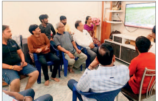
भारत की क्षमताओं को बेहद करीब से देखा तथा पीएम मोदी ने आगे

प्रधानमंत्री नरेंद्र मोदी ने अपने संबोधन में कहा कि मन की बात कार्यक्रम के 131वें एपिसोड को संबोधित करते पीएम मोदी ने आर्टिफिशियल इंटेलिजेंस पर बात की। उन्होंने कहा कि दिल्ली में हुई एआई समिट में दुनियाभर से लोग शामिल हुए। उन्होंने एआई के क्षेत्र में